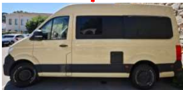
↑ Lateral izquierdo