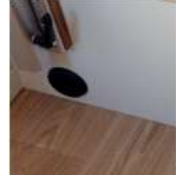
Salida aire caliente