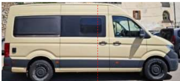
↑ Lateral derecho