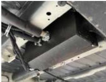
Foto del equipo y del sistema de fijación

Opción 1: Equipo ubicado bajo el vehículo