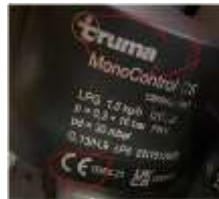
Regulador de gas