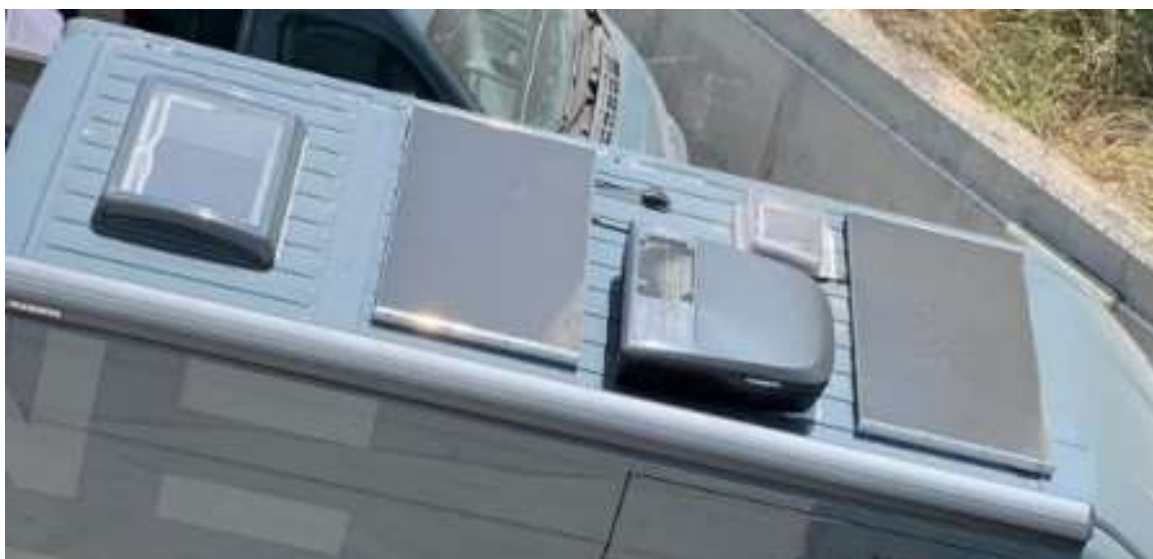
Una foto general mostrando todo el techo del vehiculo en una sola foto