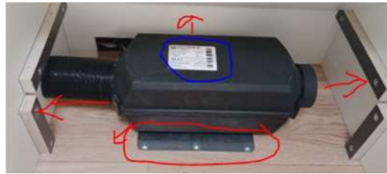
Foto del equipo mostrando el sistema de fijación al suelo, y conforme no toca a ningún material inflamable, y que hay espacio libre por la entrada y salida de aire

Opción 2: Equipo ubicado en el interior del vehículo