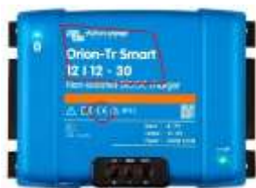
Booster o cargador DC-DC